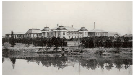
名古屋高等工業学校

ものづくり産業の世界的な集積地である中京地域とともに、工学のほとんどの分野をカバーするわが国屈指の国立工学系単科大学として、これからも成長・発展を続けていきます。