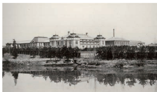
名古屋高等工業学校

ものづくり産業の世界的な集積地である中京地域とともに、工学のほとんどの分野をカバーするわが国屈指の国立工学系単科大学として、これからも成長・発展を続けていきます。