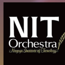
アンサンブル 名古屋工業大学管弦楽団 +ゲストプレイヤーズ