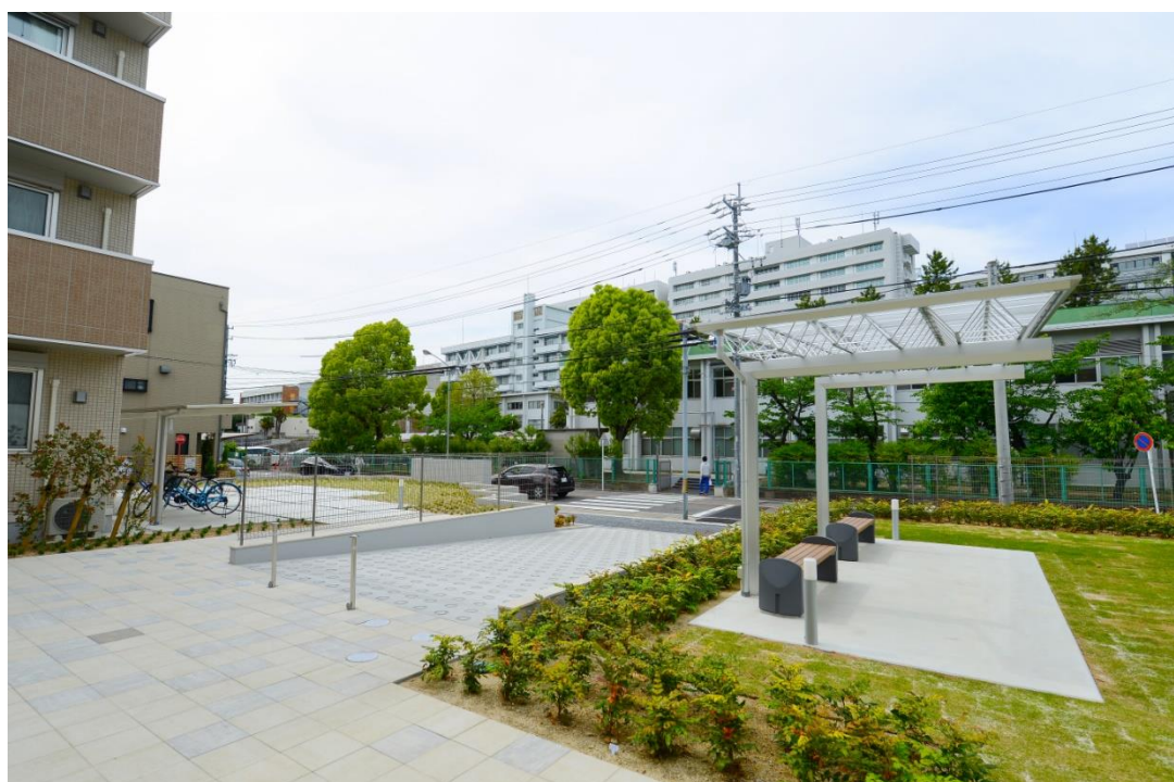
道を渡るとキャンパスです