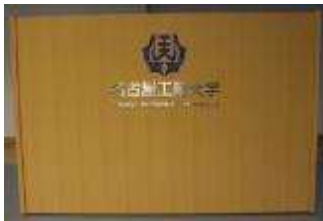
演台 大 1台 W150cm×50D cm×H100 cm