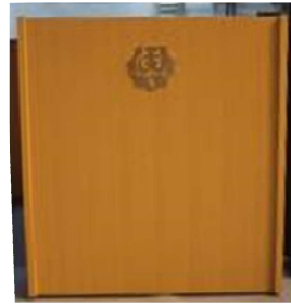
演台 小 1台 W90cm×D50cm×H100 cm