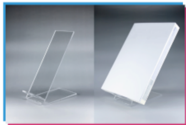
レーザ接合 機械工学科 早川研究室

NIT DESIGN PROJECTがみつけてきた名古屋工業大学のすごい技術을展示します。さわれる仕掛けが盛りだくさんの展示です。技術とデザインのコラボレーションを体験しにきてください！