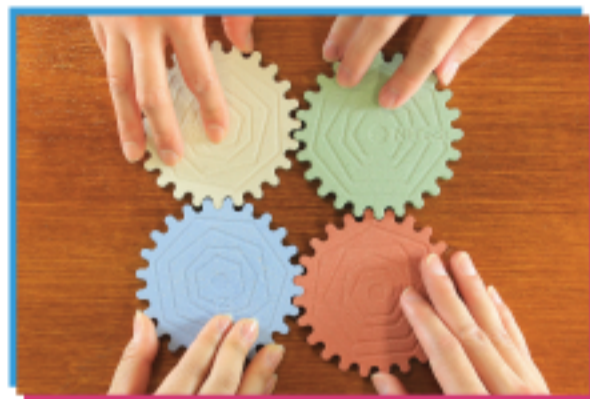
無焼成セラミックス 先進セラミックス研究センター 藤研究室