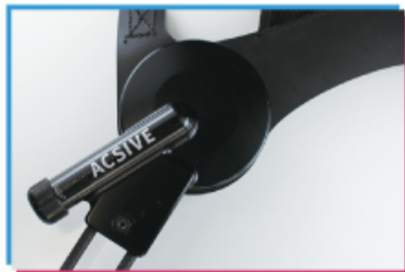
無動力歩行支援機 ACSIVE 機械工学科 佐野研究室